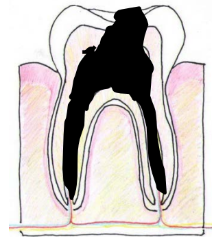
Caria se extinde